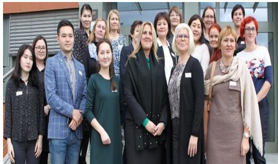
ProInCa командасы Словенияда мейірбике ісі жөніндегі мастер-класста

Бұдан басқа, болашақта, МІЖО-ның веб-сайтында мейірбике ісі бойынша клиникалық ұсынымдар туралы ақпарат орналастырылатын болады. МІЖО электрондық платформасы сондай-ақ бірлесіп жұмыс істеуге мүмкіндік береді және Moodle-де әзірленген курстармен электронды оқыту ортасын қамтиды. Moodle ортасындағы алғашқы курстарда мейірбике ісі оқытушылары үшін материалдар болады. Мастер-класс кезінде, Астанада (сәуір) қатысушылар МІЖО және электрондық платформаны одан әрі дамыту бойынша жұмыс істейтін болады. МІЖО Астана қаласының Медицина университетінің құрылымдық бөлімшесі болады.